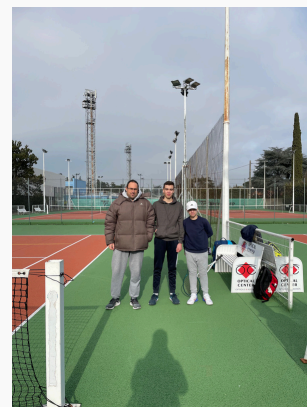
Equipe U16 Garçons