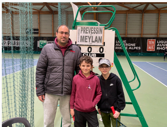
Equipe U12 Garçons